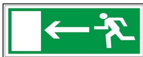
Kierunek do wyjścia drogi ewakuacyjnej