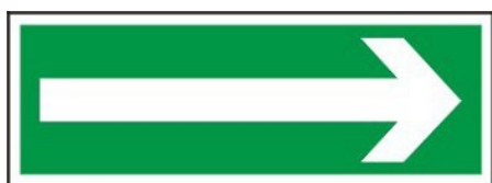
Kierunek drogi ewakuacyjnej